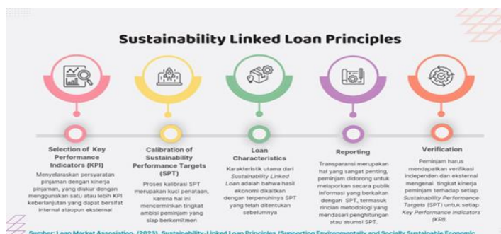
Gambar 1 Komponen Inti Sustainability Linked Loan Principles (Gambar diolah oleh penulis)

Sustainable Linked Loan (SLL) memiliki prinsip-prinsip dasar yang membantu memastikan bahwa pinjaman tersebut benar-benar berkontribusi pada tujuan keberlanjutan. Berikut adalah prinsip-prinsip utama yang biasanya diadopsi dalam sustainable linked loan (Media Digital, 2022):