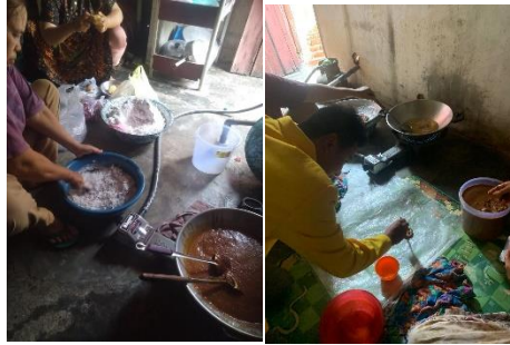
Gambar 2. proses bahan baku kue cucur