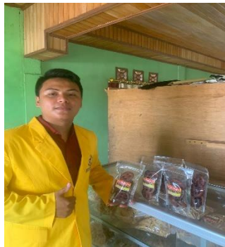
Gambar 3. Proses jadi kue cucur

Sesudah selesai waktu fermentasi, waktunya adonan di cetak menggunakan plastik yang mana adonan diambil sedikit demi sedikit kemudian adonan tersebut di bulatkan menggunakan alat bantu plastik untuk memutar adonan menjadi bulat lalu sesudah adonan tercetak dengan sempurna adonan tadi di bolongi menggunakan kayu, selanjutnya adonan yang sudah tercetak sempurna tadi siap untuk di goreng sampai garing kemudian di angkat dan ditiriskan didalam talam.