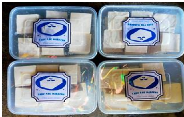
Gambar 3 Pengemasan Tahu

Solusi pertama adalah kemasan yang baik dapat mendukung kebersihan produk. Pada aspek ini, memaparkan bahwa kebersihan makanan dapat juga dilihat dari kemasan produk itu sendiri. Kemasan produk yang rapi memberikan visualisasi yang bersih terhadap produk yang dibeli terlebih lagi produk makanan. Hal ini sejalan dengan penjelasan Theopilus, Damayanti, Yogasara, & Ariningsih (2018) dimana kemasan yang secara visual memberikan kesan bersih menjadi faktor penting dan dapat membentuk faktor untuk membeli. Tahu yang diproduksi secara langsung oleh Pabrik Tahu kemudian dijual secara langsung dengan kemasan seadanya. polusi di luar ruang dapat menjadikan kemasan plastik menjadi buram dan terdapat debu yang menempel pada kemasan. Sebagai pelaku usaha, penting untuk berinovasi dan memahami standar yang diinginkan oleh konsumen. Oleh karena itu, maksud dari pengabdian masyarakat ini adalah untuk memberikan usulan agar kemasan tahu dibuat tertutup rapat. Hal ini dapat dilakukan dengan cara mengganti kemasan pelastik menjadi box dan diberi merk. hal ini secara estetika memberikan kesan lebih sebagai nilai jual produk.