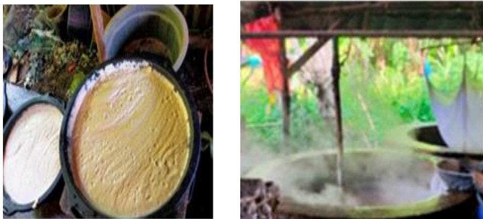
Gambar 2 Proses Produksi Olahan Produk Tahu

Setelah dari proses produksi, tanya jawab mengenai proses pengemasan produk dilakukan di titik lokasi usaha. Pada tahapan inilah lebih banyak dilakukan pendekatan solusi terhadap permasalahan yang ditemukan Berdasarkan hasil observasi di lokasi usaha dalam hal pengemasan produk tahu, pada tahap ini menjelaskan tiga aspek sebagai solusi untuk meningkatkan nilai jual produk tahu