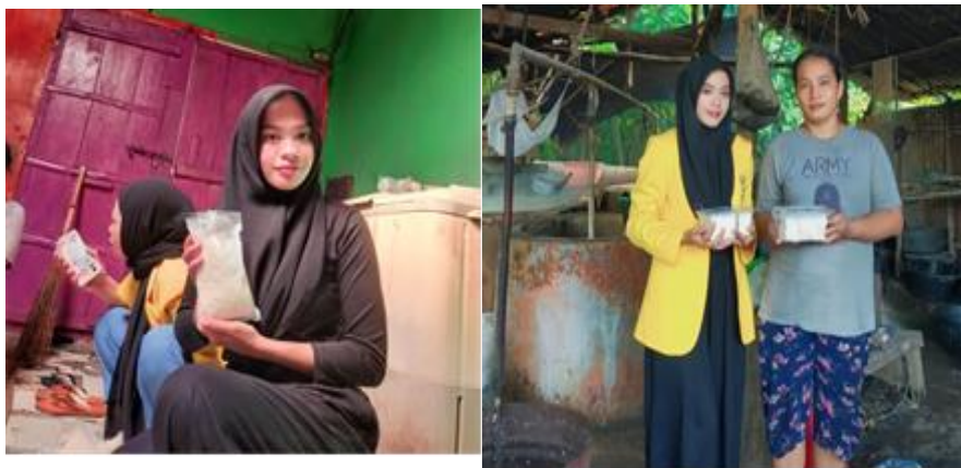
Gambar 4 Dokumentasi Kegiatan Pengabdian

Dengan demikian, usulan yang dapat diberikan pada aspek ini sebagai suatu solusi yaitu dapat mencatumkan informasi mengenai pemilik pabrik atau merk. Tidak jarang tahu dan tempe yang dibeli tidak langsung dikonsumsi konsumen. Dengan adanya informasi tersebut dapat memberikan informasi yang edukatif yang secara tidak langsung memberikan nilai lebih terhadap produk tahu yang dibeli