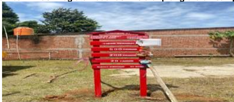
Gambar 2 Hasil kegiatan edukasi melalui plang uraian sampah

Selain menghasilkan luaran fisik berupa rencana edukasi, kegiatan ini juga meningkatkan pemahaman awal masyarakat mengenai dampak jangka panjang sampah anorganik terhadap lingkungan. Berdasarkan hasil pengamatan lapangan setelah pemasangan plang, masyarakat mulai menunjukkan ketertarikan terhadap informasi yang disajikan, seperti membaca isi plang dan membicarakannya secara informal dengan warga lainnya. Hal ini menunjukkan bahwa media visual statistik mampu menarik perhatian dan menjadi sarana komunikasi pesan lingkungan yang efektif.