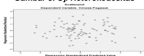
Gambar 3. Uji Heterokedesitas

Berdasarkan data yang tersaji pada Tabel 4, diketahui bahwa seluruh variabel independen memiliki nilai tolerance yang tidak berada di bawah batas ketentuan, yaitu 0,1, serta nilai Variance Inflation Factor (VIF) yang tidak melebihi batas yang ditetapkan, yaitu 10. Dengan demikian, dapat disimpulkan bahwa variabel dalam penelitian ini tidak mengalami masalah multikolinearitas.