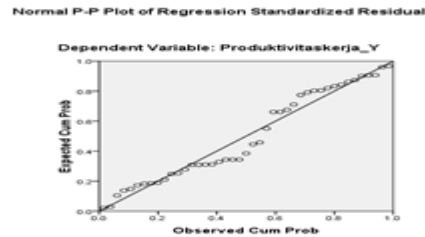
Gambar 1 Hasil uji normalitas

Gambar di atas menunjukkan bahwa titik-titik pada model regresi tersebar secara merata dan disepanjang garis diagonal dan merapat sehingga dapat disimpulkan bahwa data terdistribusi normal dan memenuhi asumsi normalitas.