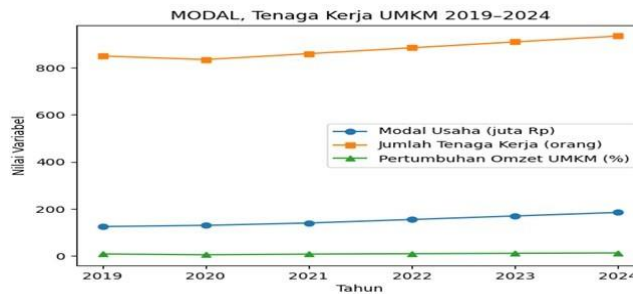
Gambar 1. Modal, Tenaga Kerja, UMKM 2019-2024

Grafik menunjukkan tren positif pada modal, tenaga kerja, dan omzet UMKM periode 2019-2024. Peningkatan modal terbukti memperkuat kapasitas finansial dan mendorong ekspansi usaha, sementara pemulihan jumlah tenaga kerja pasca-2020 yang dibarengi lonjakan omzet sejak 2021 mengonfirmasi bahwa penguatan faktor produksi secara efektif meningkatkan kinerja penjualan. Secara keseluruhan, sinergi antara tambahan modal dan tenaga kerja berkontribusi langsung terhadap pertumbuhan pendapatan UMKM secara konsisten.