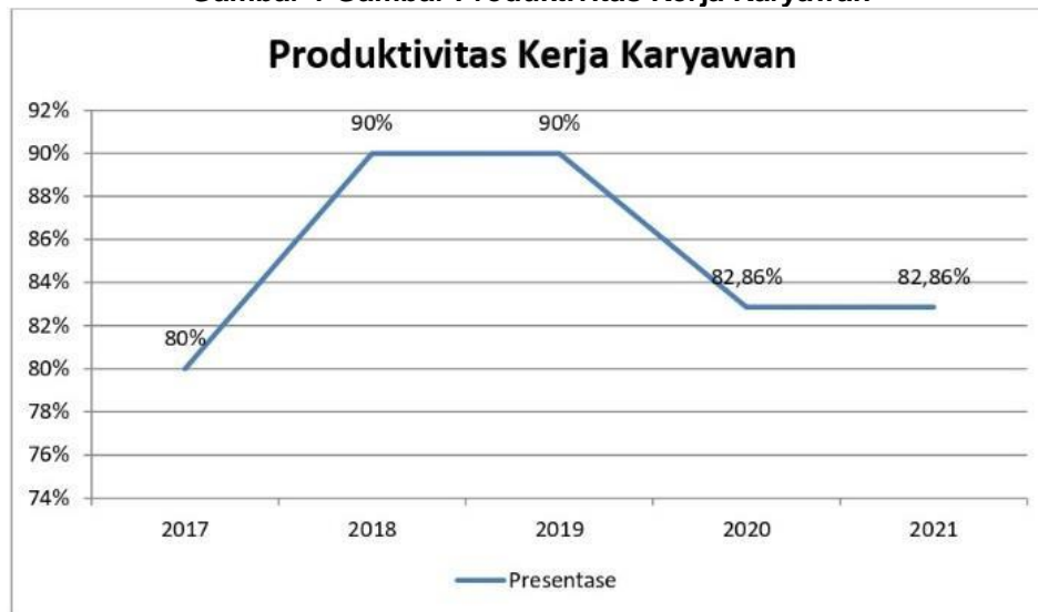
Gambar 1 Gambar Produktivitas Kerja Karyawan