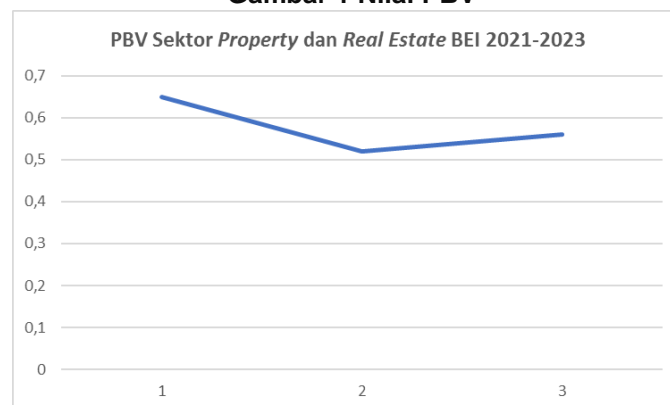
Gambar 1 Nilai PBV