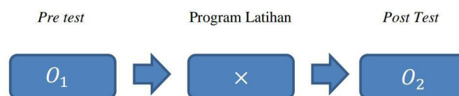
Gambar 1.3 Metode penelitian

Metode Penelitian menurut Sari, D. P., & Hidayati, N. (2023) merupakan suatu kegiatan yang ditujukan untuk menyelidiki sebuah keadaan, ataupun sebuah alasan, serta konsekuensi terhadap suatu keadaan khusus, bisa juga sebuah fenomena atau variabel. Metode eksperimen dengan sampel tidak terpisah maksudnya peneliti hanya memiliki satu kelompok (sampel) saja, yang diukur dua kali, pengukuran pertama dilakukan sebelum subjek diberi perlakuan (pretest), kemudian perlakuan (treatment), yang akhirnya ditutup dengan pengukuran kedua (posttest). Desain yang digunakan dalam penelitian ini adalah "The One Group Pretest Posttest Design" atau tidak adanya grup kontrol. Sesuai dengan penelitian ini yaitu untuk melihat pengaruh Latihan variasi terhadap keterampilan dribbling ekstrakurikuler futsal di SMP N 44 Seluma dengan menggunakan rancangan eksperimen :